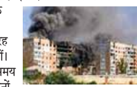
रूस का यूक्रेन पर भीषण हमला

कीव। यूक्रेन के राष्ट्रपति वलोडिमिर जेलेंस्की ने बताया कि रूस ने रात भर में यूक्रेन पर एक बहुत बड़ा हमला किया है। इस दौरान रूस ने लगभग 450 लंबी दूरी के ड्रोन और 70 अलग-अलग तरह की मिसाइलें दागीं। यह हमला ऐसे समय में हुआ है जब दोनों देश संयुक्त अरब अमिरात के अबू धाबी में शांति वार्ता करने वाले हैं। जेलेंस्की के अनुसार, रूस ने यूक्रेन के पांच राज्यों में बिजली ग्रिड को निशाना बनाया। कड़ाके की ठंड के बीच रूस का मकसद नागरिकों को बिजली, पानी और हीटिंग से महरूम रखना है।