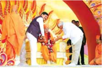
पूज्य महंत स्वामी महाराज से आशीर्वाद लेते सीएम।

मुख्यमंत्री डॉ. यादव ने महंत स्वामी महाराज के 92 वें जन्मजयंती महोत्सव में 15 हजार 666 बच्चों को एक साथ स्वामी जी की ओर से रचित 'सत्संग दीक्षा' ग्रंथ के 315 श्लोकों का पाठ किए जाने को एक उपलब्धि बताया। इस गतिविधि का नया गिनीज वर्ल्ड रिकॉर्ड भी बना है। मुख्यमंत्री और गुजरात के मुख्यमंत्री पटेल ने महंत स्वामी महाराज से जनकल्याण के लिए आशीर्वाद प्राप्त किया। कार्यक्रम में गुणातितांद स्वामी की अद्भुत महिमा एवं जीवन पर केंद्रित नाटक का मंचन किया गया। इससे पहले मुख्यमंत्री डॉ. यादव के वडोदरा इंटरनेशनल एयरपोर्ट पहुंचने पर गुजरात के मुख्यमंत्री पटेल ने आत्मीय स्वागत किया।