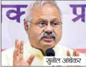
एजेसी ॥ मुंबई

यूजीसी के नए इक्विटी नियमों पर संघ की राय समाज की एकता सर्वोपरि, इसके लिए हम हर जरूरी कदम उठाएंगे