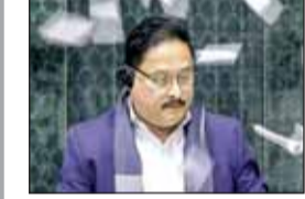
भाजपा सांसद दिलीप सैकिया नई दिल्ली में संसद के बजट सत्र के दौरान लोकसभा की अध्यक्षता करते हुए

लोकसभा स्पीकर पर 'फेंके' गए पेपर, विपक्ष के 8 सांसद सस्पेंड