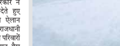
अनंतनागा। अनंतनागा जिले के पहलामाम में मंगलवार को सदियों के दौरान हुई ताजा बर्फारी के बाद खड़ी गाड़ियां मोटी बर्फ से ढंक गईं।