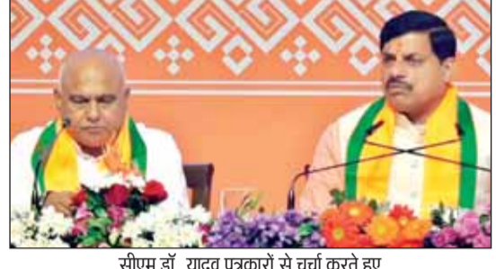
सीएम डॉ. यादव पत्रकारों से चर्चा करते हुए

मप्र को एक सुदृढ़ वित्तीय आधार प्राप्त होगा, निवेशकों का विश्वास और बढ़ेगा