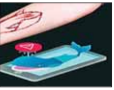
हरिभूमि न्यूज ॥ गोपाल

मोबाइल पर गेम ने जान ले ली ब्लू व्हेल गेम का 'टास्क' पूरा करने छात्र फ्रांसी पर झूल गया