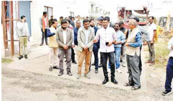
नामांतरण से संबंधित मिले। मैदान में उतरे अधिकारी, मौके पर

जबलपुर। शहर के चहुंमुखी विकास और नागरिक सुविधाओं को बेहतर बनाने के उद्देश्य से नगर निगम जबलपुर द्वारा नए सिरे से संपत्तियों के सर्वे कराया जा रहा है। इसके अंतर्गत ये देखा जा रहा है कि संपत्ति आवासीय, कर्मशियल, नई सम्पत्ति और किराएदारी की है, तो उसे चिन्हित करते हुए मौके पर ही सम्पत्तियों की वास्तविक स्थितियों की जानकारी दर्ज की जा रही है। इसी कड़ी में आज संभाग क्रमांक 15 सुहागी के वार्ड क्रमांक 72 में एक वृहद सर्वे अभियान चलाया गया। सर्वे कार्य के दौरान टीम ने सक्रियता दिखाते हुए 274 संपत्तियों का मौके पर सत्यापन किया। इस दौरान 34 प्रकरण किराएदारी, 26 प्रकरण निर्माण क्षेत्र में वृद्धि, 08 प्रकरण नई संपत्तियों, एवं 14 प्रकरण