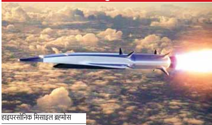
हाइपरसोनिक मिसाइल ब्रह्मोस