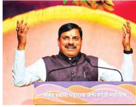
कार्यक्रम को संबोधित करते सीएम डॉ. मोहन यादव।

मग्न से जुड़ी हैं स्वामी जी की जीवन यात्रा की जड़ें: सीएम