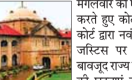
उत्तर प्रदेश में कथित बुलडोजर कार्रवाई को लेकर इलाहाबाद हाईकोर्ट ने एक बार फिर सख्त रुख अपनाया है।