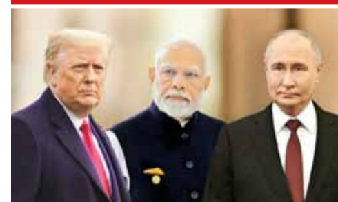
डोनाल्ड ट्रंप पीएम नरेंद्र मोदी व्लादिमीर पुतिन

मांग का 88% आयात कर रहा भारत भारत अपने कच्चे तेल का लगभग 88 प्रतिशत हिस्सा दूसरे देशों से खरीदता है, जिसे पेट्रोल और डीजल जैसे ईंधनों में परिवर्तित किया जाता है। वर्ष 2021 तक भारत द्वारा आयात किए गए कुल कच्चे तेल में रूसी तेल का हिस्सा मुश्किल से 0.2 प्रतिशत था। विश्व का तीसरा सबसे बड़ा तेल आयातक देश भारत, फरवरी 2022 में यूक्रेन पर रूस के हमले के बाद पश्चिमी देशों द्वारा मॉस्को से दूरी बनाने के बाद रियायती रूसी कच्चे तेल का सबसे बड़ा खरीदार बन गया।