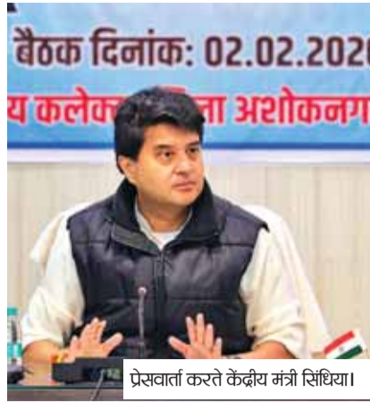
प्रेसवार्ता करते केंद्रीय मंत्री सिंधिया।

प्रधानमंत्री मोदी के नेतृत्व में समावेशी बजट जमा आकांक्षाओं को करेगा पूरा: केंद्रीय मंत्री सिंधिया