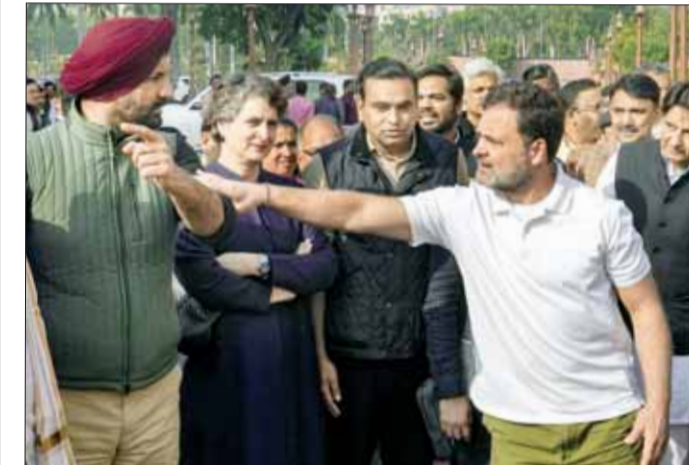
संसद के बाहर नारेबाजी और हंगामे का नजारा

भारत-अमेरिका ट्रेड डील पर विपक्ष की बयानबाजी से नहीं चली संसद