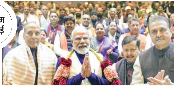
एनडीए संसदीय दल की बैठक में सहयोगी दलों के साथ प्रधानमंत्री मोदी

अमेरिका-भारत व्यापार समझौते पर खुशी जाहिर कर सत्र का फल बताया