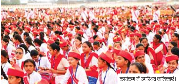
कार्यक्रम में उपस्थित बालिकाएं।

मुख्यमंत्री डॉ. यादव ने कहा कि वडोदरा एक नगर नहीं बल्कि उस सांस्कृतिक चेतना का प्रतीक है, जहां भक्ति के साथ सेवा की सुदीर्घ परम्परा है। इस धरती से गुरु के उस संदेश का प्रसार हो रहा है, जो भगवान स्वामी नारायण से लेकर पूज्य महंत स्वामीजी के जीवन में अभिव्यक्त होता है। अमृत बरसाने वाली यह धारा निरंतर प्रवाहित रहेगी। मुख्यमंत्री ने कहा कि संत वंद ईश्वर के रूप में विराजमान रहते हैं। उनकी सामूहिक उपस्थिति बगिया में अनेक पुष्पों के एक साथ खिलने की तरह होती है। अपनी शिक्षाओं से वे बच्चों को आलोकित करते हैं। निश्चित ही यह बच्चे भारतीय संस्कृति को जीवंत करने का कार्य करेंगे। दीक्षित हो रहे बच्चे भी वंदन अभिनंदन के पात्र हैं।